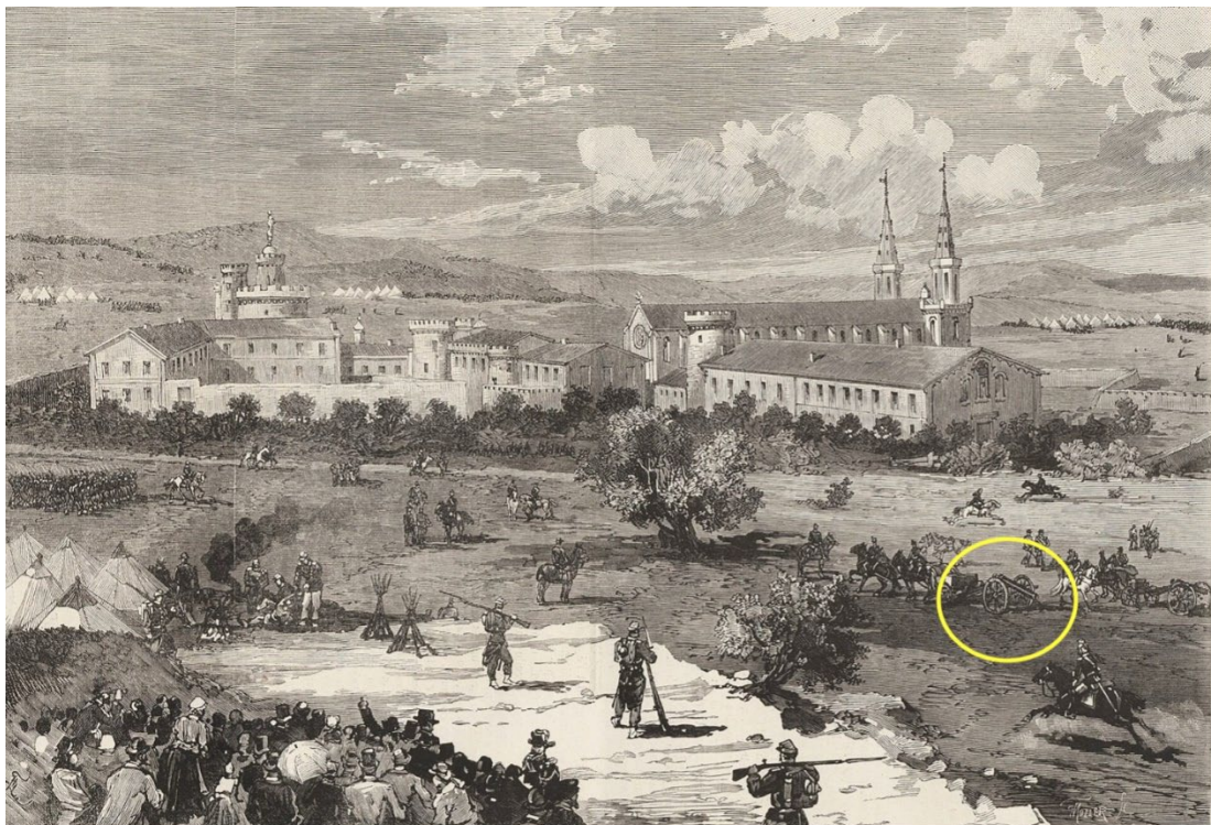
Emplacement des campements des troupes du général Guyon-Verdier autour de l'abbaye des Prémontrés de Saint-Michel de Frigolet le 8 novembre 1880

Devant cette résistance imprévue, Eugène Poubelle, préfet des Bouches-du-Rhône, va réquisitionner sur la demande du général Farre, alors ministre de la Guerre, le général Guyon-Vernier et le mettre à la tête du 26ème régiment de dragons pour aller déloger les Prémontrés. Disposant de trois escadrons - c'est-à-dire 240 cavaliers -, le général met en place un blocus de l'abbaye, empêchant quiconque d'entrer, mais permettant aux assiégés de sortir - ce que ces derniers mettent à profit pour faire évacuer les femmes. Comme on peut le noter sur la gravure ci-dessous des canons, pointant vers l'abbaye, sont aussi installés.